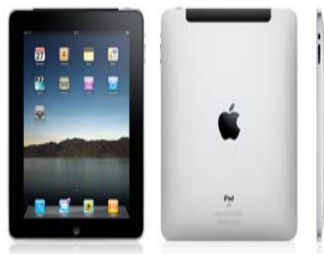
Modelo: Wi-Fi + 3G 16 Gb

puedes elegir entre... Un IPAD , Una TV Sony LED, un ordenador portátil HP, una tarjeta prepago con 500€ ó una tarjeta prepago con 1.000€