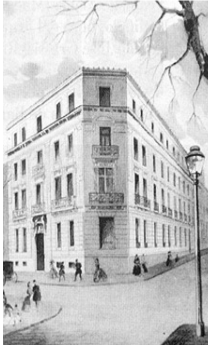
Fundado en 1902