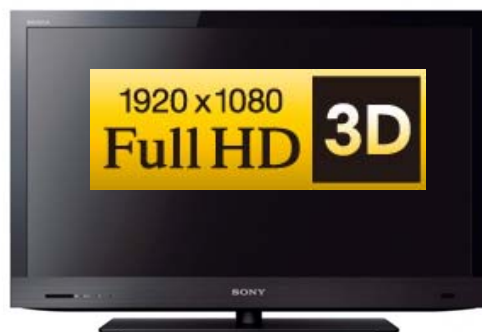
TV 32" (81cm), 3D Full HD, Motionflow XR 200, Edge LED, X-Reality, Wi-Fi integrada, Skype, Qriocity, Bravia Internet Video

Portátil Compaq de HP, Procesador Intel® Celeron Dual Core T3500, Memoria 2GB, disco duro 250 GB, DVD grabador, Intel Graphics Media Accelerator 4500MHD, Windows 7 Premium